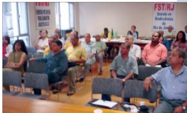
“Apoiamos a ação popular que barra os efeitos da MP 258 até que o Congresso e a sociedade discutam. Não aceitamos esta atitude ditatorial do governo Lula que impõe mudança inconstitucional no controle sobre as verbas da Previdência Social”, comentaram os sindicalistas que prometeram ir às ruas protestar.