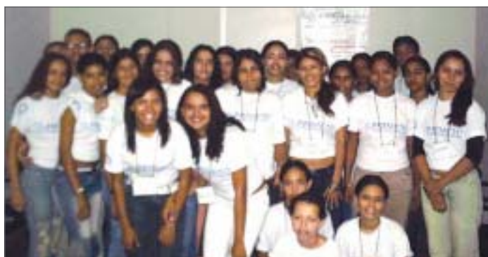
Os 27 formandos avaliaram o curso de Técnica de Vendas: "Ficamos satisfeitos com a qualidade do curso e com os temas desenvolvidos. Saímos daqui certos de que o SINPROVERN prepara profissional e culturalmente novas gerações".